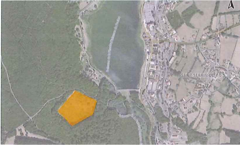
Jachères Les Brûlées/ Photovoltaïque au sol