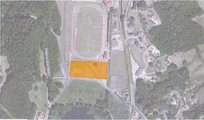
Parking Stade/ Solaire/Ombrières