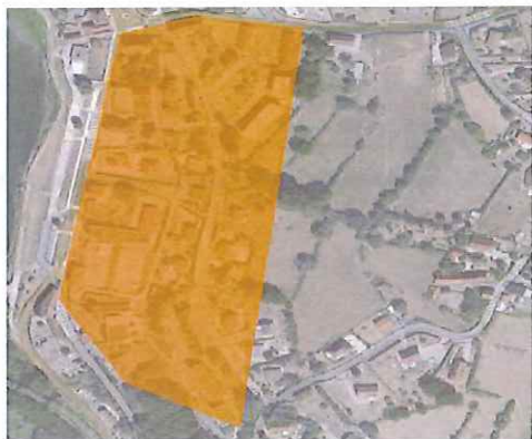
Centre Bourg/Bois Energie/Biomasse