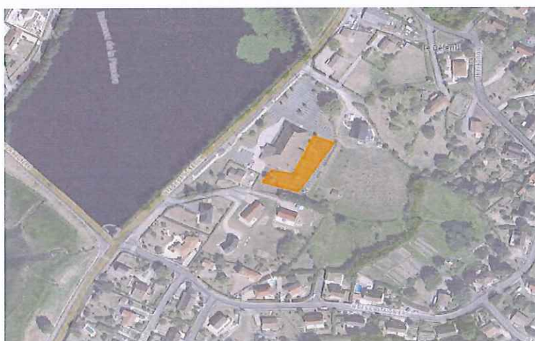
Parking salle polyvalente/Solaire/Ombrières