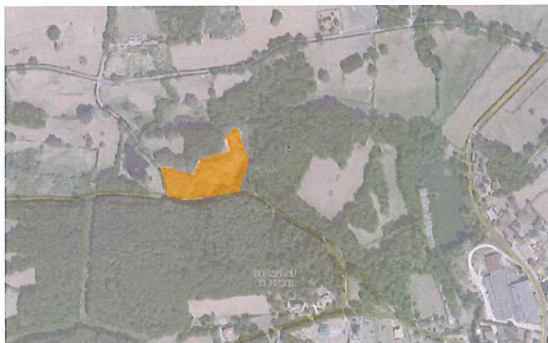
Dravonne/ Photovoltaïque au sol